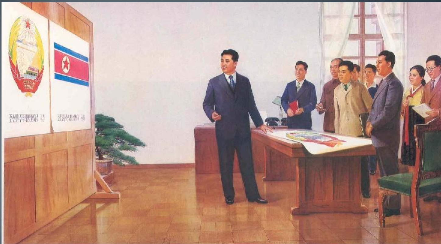
수채화 《조선민주주의인민공화국 국기와 국장 도안을 지도하여주시는 위대한 수령 김일성동지》 함창연, 정통석 水彩画《伟大领袖金日成同志审核朝鲜民主主义人民共和国国旗、国徽图案》 咸昌渊、郑龙锡

Translation: "The Great Leader Kim Il-Sung directing design of Democratic People's Republic of Korea flag and emblem"