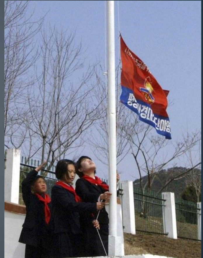
Songdo International Boys Camp Flag